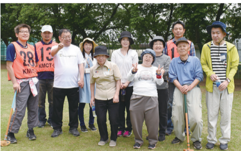
チームみんなで「ハイポーズ」